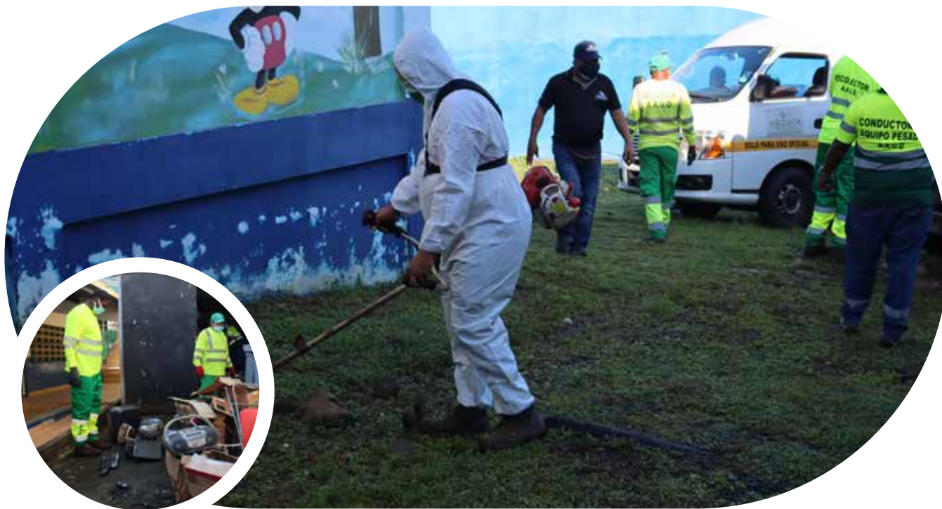
Programa de limpieza integral de escuelas de Panamá Centro y Panamá Norte.